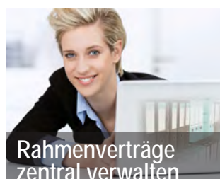
Rahmenverträge zentral verwalten

Sind die Verträge mit ihren vereinbarten Leistungen, Preisen und Konditionen erst einmal erfasst, hat man stets Zugriff auf alle nötigen Informationen für Bestellungen, genaue Rechnungsprüfung und viele weitere Funktionen.